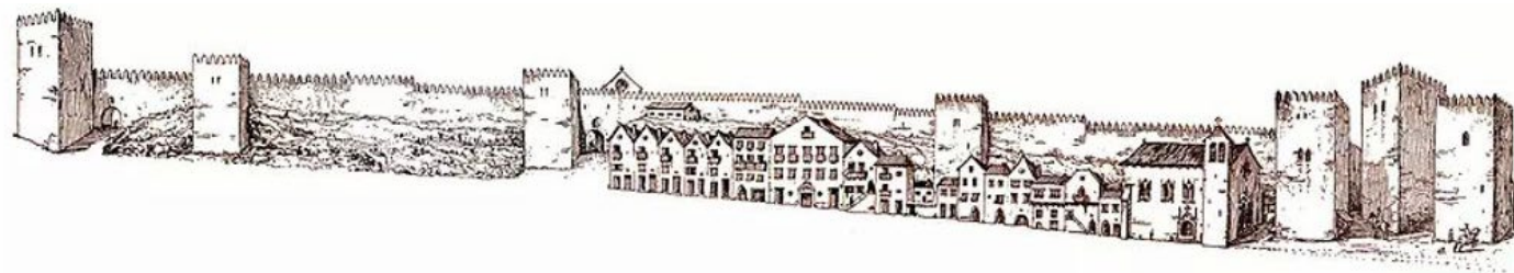
Desenho de Alberto de Sousa (c. 1938)

Exterior à muralha, o traçado da rua pouco se alterou até aos nossos dias apesar do desaparecimento dos edifícios construídos junto à cerca fernandina e da demolição do Convento da Trindade.