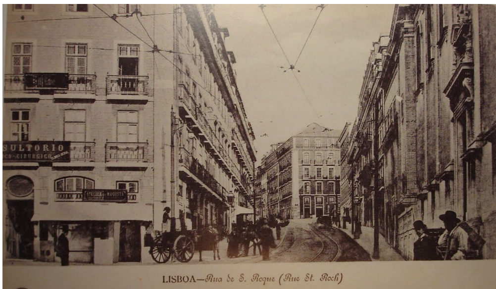
Rua de S. Roque na primeira década do séc. XX