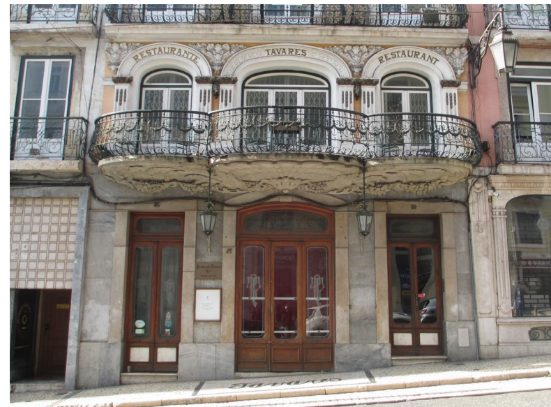
Fachada atual do Restaurante Tavares, na Rua da Misericórdia, n.º 37