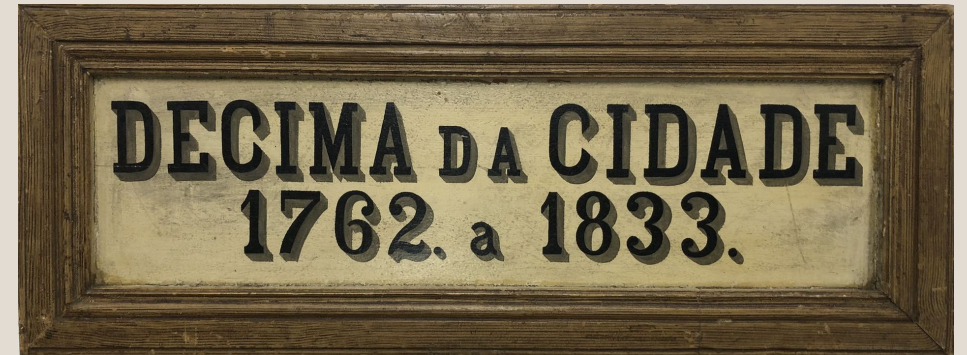
Placa existente no Arquivo Histórico do Tribunal de Contas que identificava a localização no depósito do subconjunto documental da Décima da Cidade