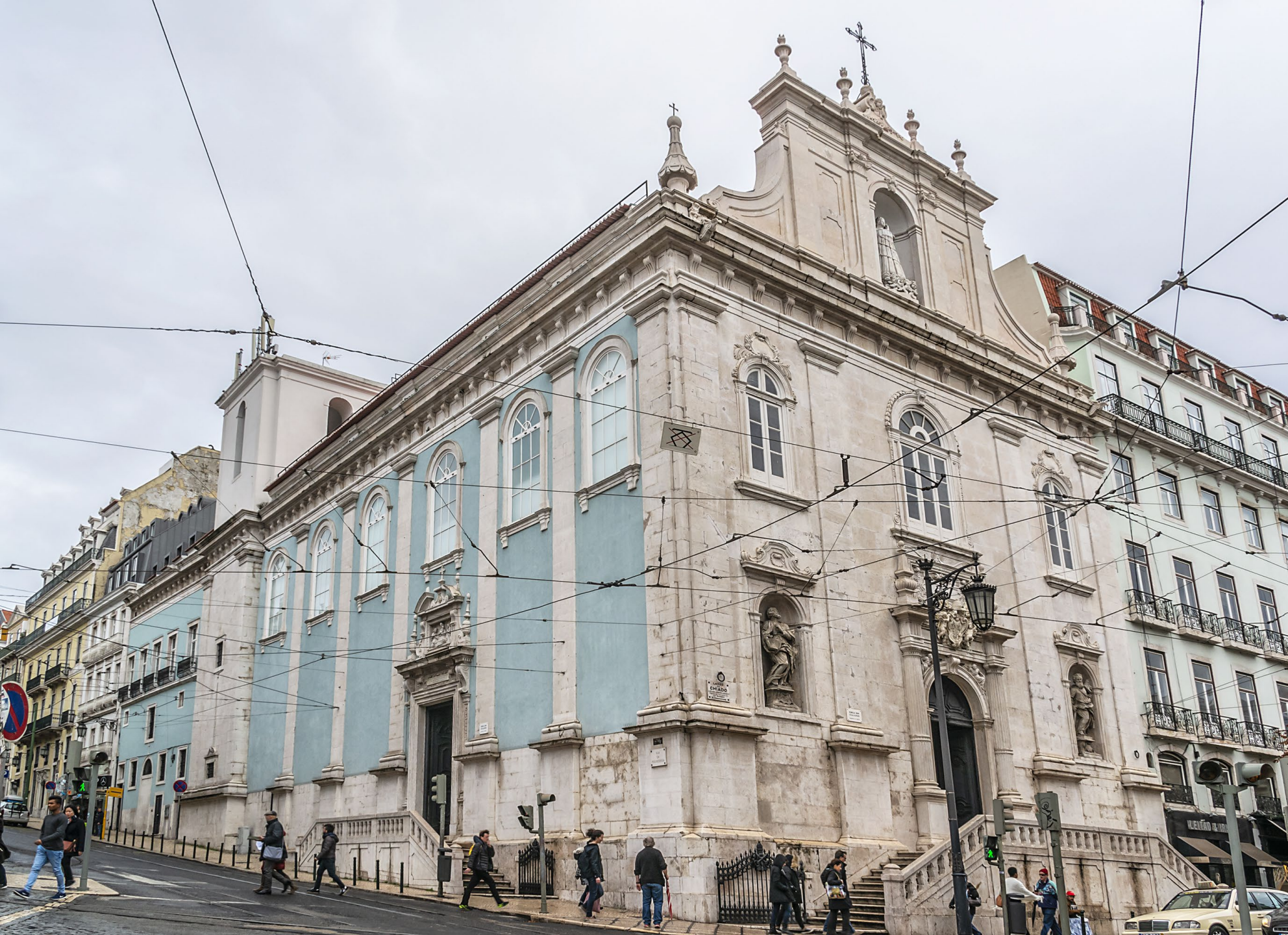
Igreja de Nossa Senhora do Loreto - a Igreja dos Italianos em Lisboa

A Igreja foi edificada por iniciativa da comunidade italiana residente em Lisboa no séc. XVI. Aberta ao culto em 1522, ficou sob a direta proteção do Papa e agregada à Basílica de São João de Latrão (Sé de Roma).