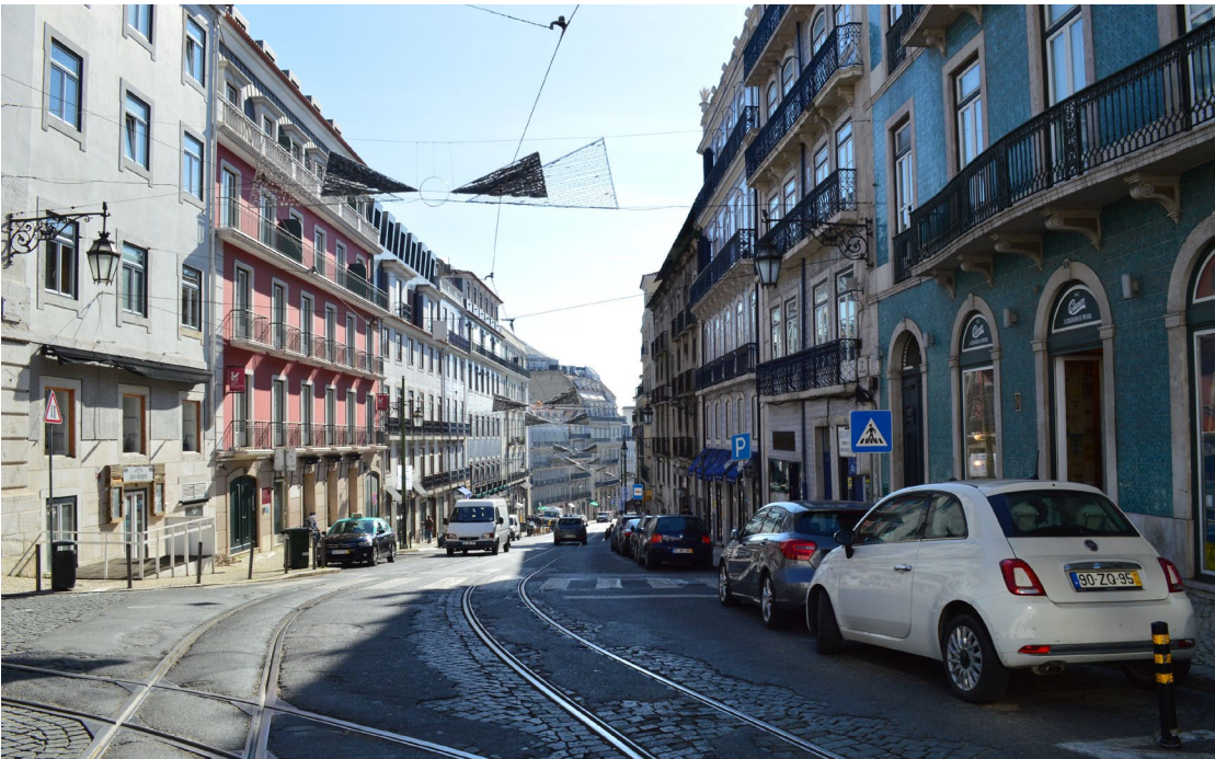
Rua da Misericórdia