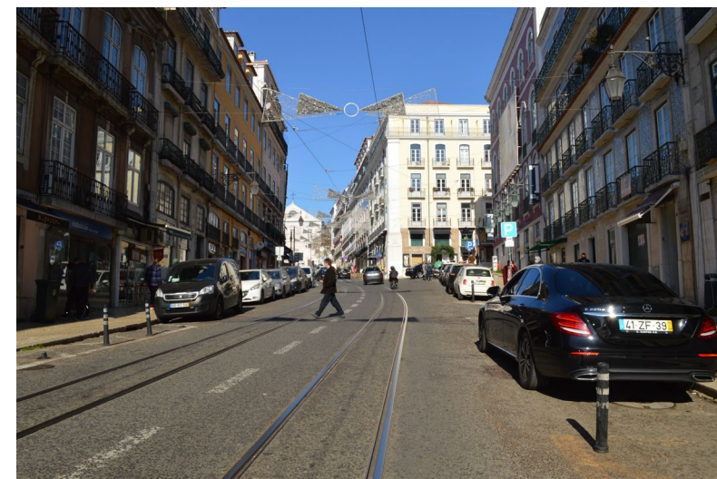
Rua da Misericórdia