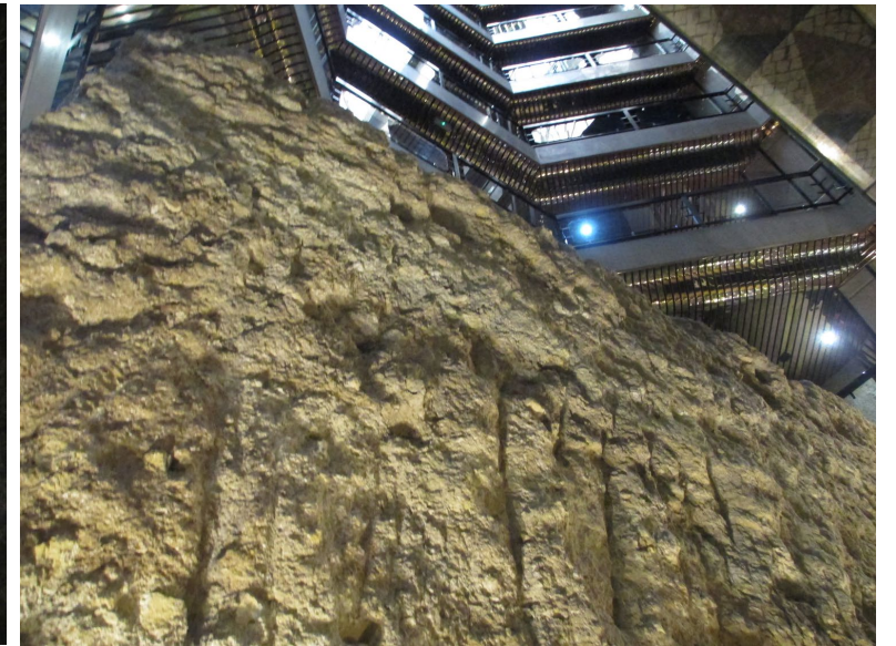
Vestígios da cerca fernandina ainda hoje existentes nos edifícios da Rua da Misericórdia, neste caso, no Espaço Chiado